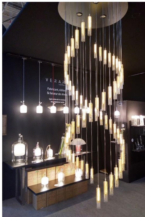
Création d'un nouveau lustre A.D.N.